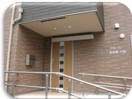
玄関 スロープのある広々とした玄関はお出かけにも安心です。

介護の必要なお年寄りが、家庭的な雰囲気の中で、ゆったりと自由に暮らす事ができます。少人数制で専門性の高いスタッフと共同生活を営みながら、認知症の緩和をうながすことを目的とした介護サービスです。