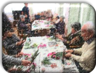
フラワーアレンジメント