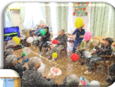
レクリエーション風景

利用者やご家族の必要に応じ、通い慣れた環境の中で宿泊が可能です。緊急時にも対応いたします。